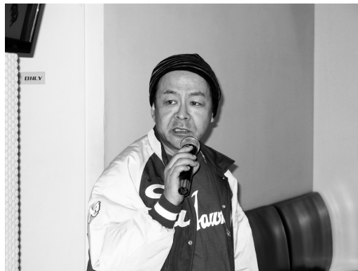
●塚原事務局長あいさつ