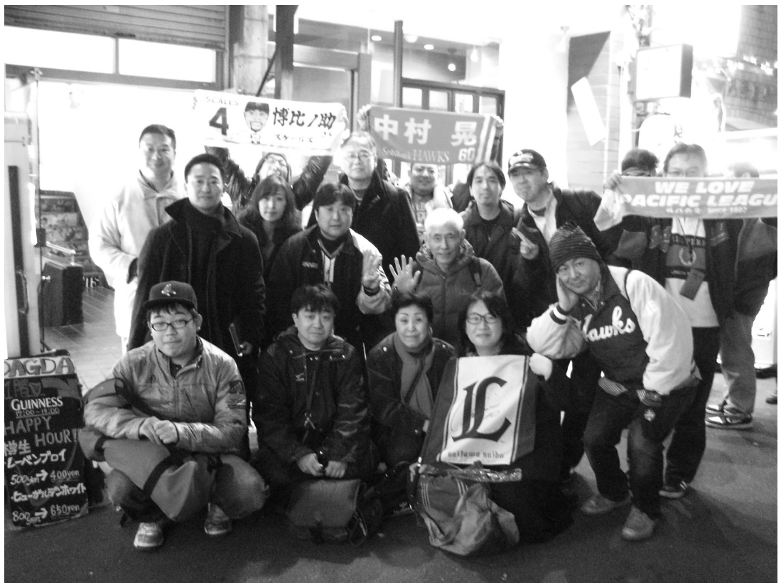
●2次会の参加者で記念撮影