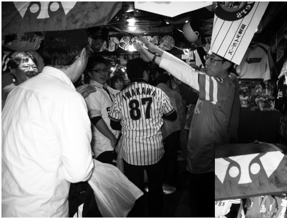
●帰路に向かう会員を ホークスファンのグループがお見送り (リリーズ神田スタジアムにて)