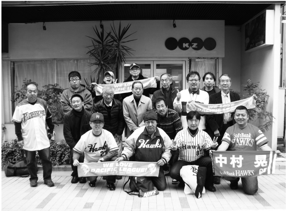
●納会参加者で記念撮影