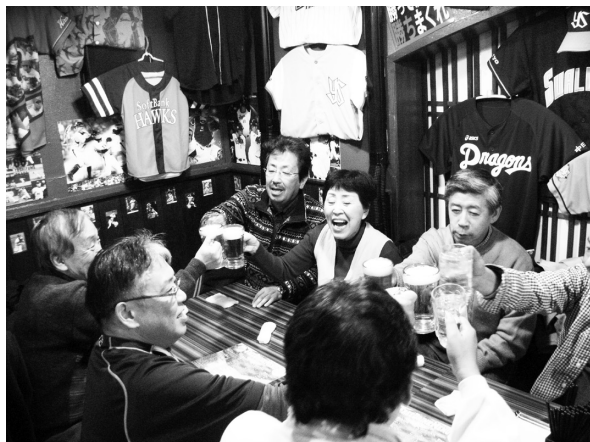
●2次会のようす (リリース神田スタジアムにて)

御茶ノ水のケーズでの納会が終わり、ほとんどの参加者はそのまま徒歩で今度は2次会の会場である、神田のベースボール居酒屋「リリース神田スタジアム」へ移動しました。これまでは夜も遅い時間からの二次会だったのですが、今回は一次会が昼の開催ということもあり、開店前にリリースに到着するというハプニング。それでもお店に入り、納会場から移動した会員に加えて、2次会からの参加者も次々と会場に到着して、再び乾杯！そして再び歓談へ。近くにいたホークスファンのグループともエールの交換をしたりと、大いに盛り上がった2次会となりました。